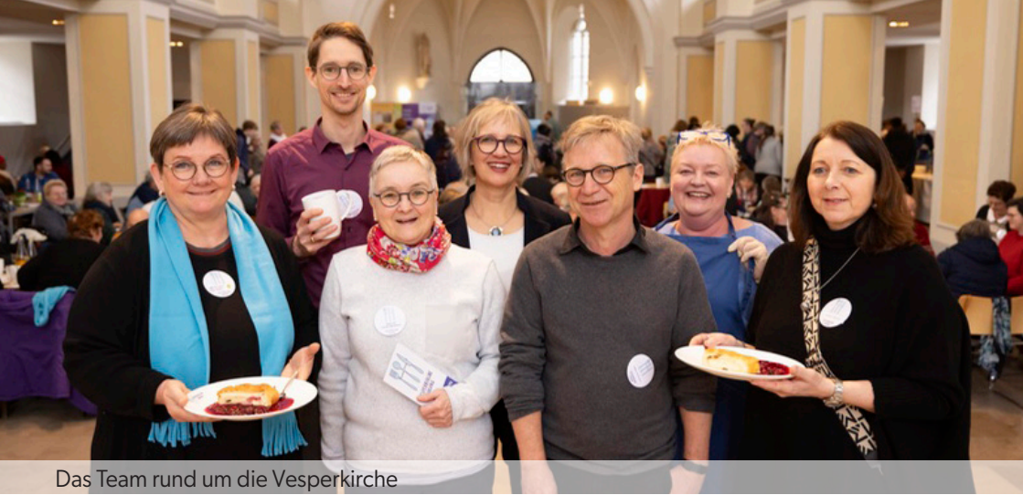
Das Team rund um die Vesperkirche