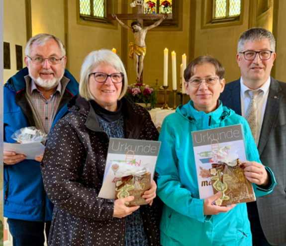
Bläserührung des Posaunenchors