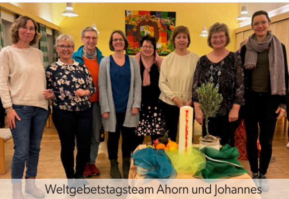
Weltgebetstagsteam Ahorn und Johannes