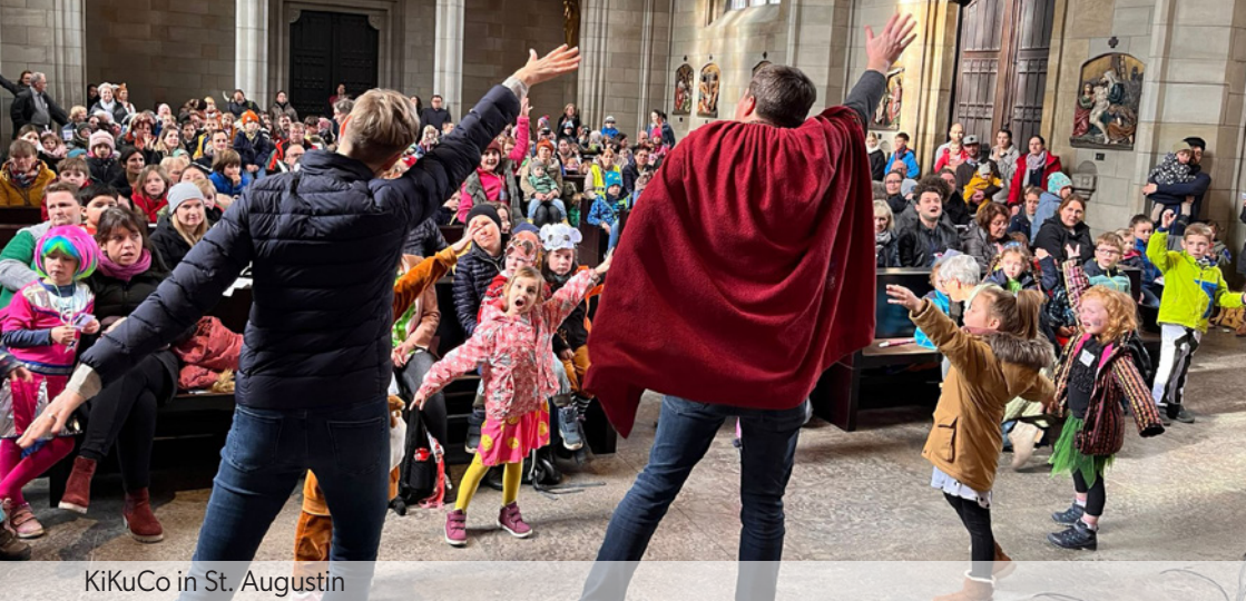
KiKuCo in St. Augustin