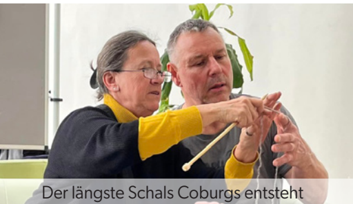
Der längste Schals Coburgs entsteht