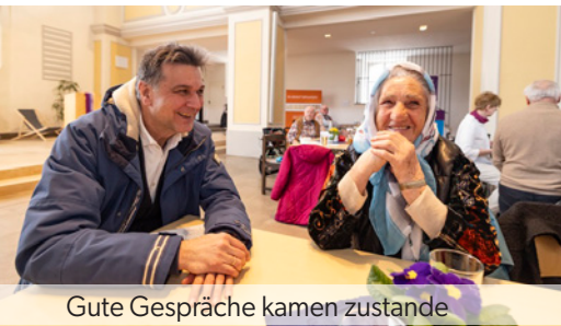
Gute Gespräche kamen zustande