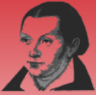
Katharina von Bora