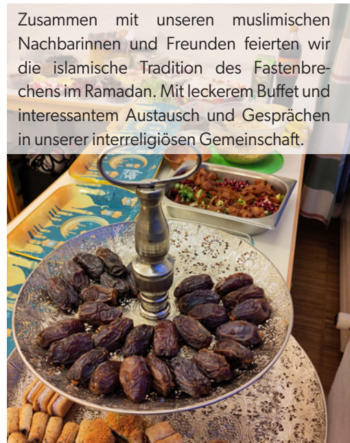
Zusammen mit unseren muslimischen Nachbarinnen und Freunden feierten wir die islamische Tradition des Fastenbrechens im Ramadan. Mit leckerem Buffet und interessantem Austausch und Gesprächen in unserer interreligiösen Gemeinschaft.